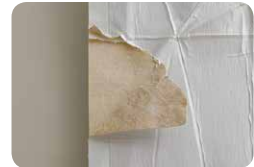
間の紙が茶色いもの